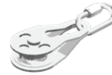
P-11 KÖŞE DÖNÜŞ MAKARASI