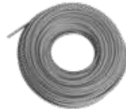
LL-200 B YAŞAM HALATI