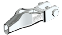
ES-300 U HALAT SONLANDIRICI